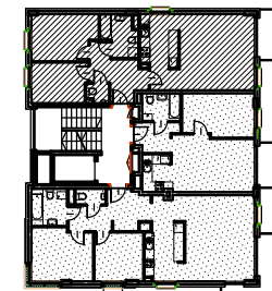
SCHEMAT 2 PIĘTRA