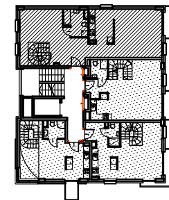
SCHEMAT 3 PIĘTRA